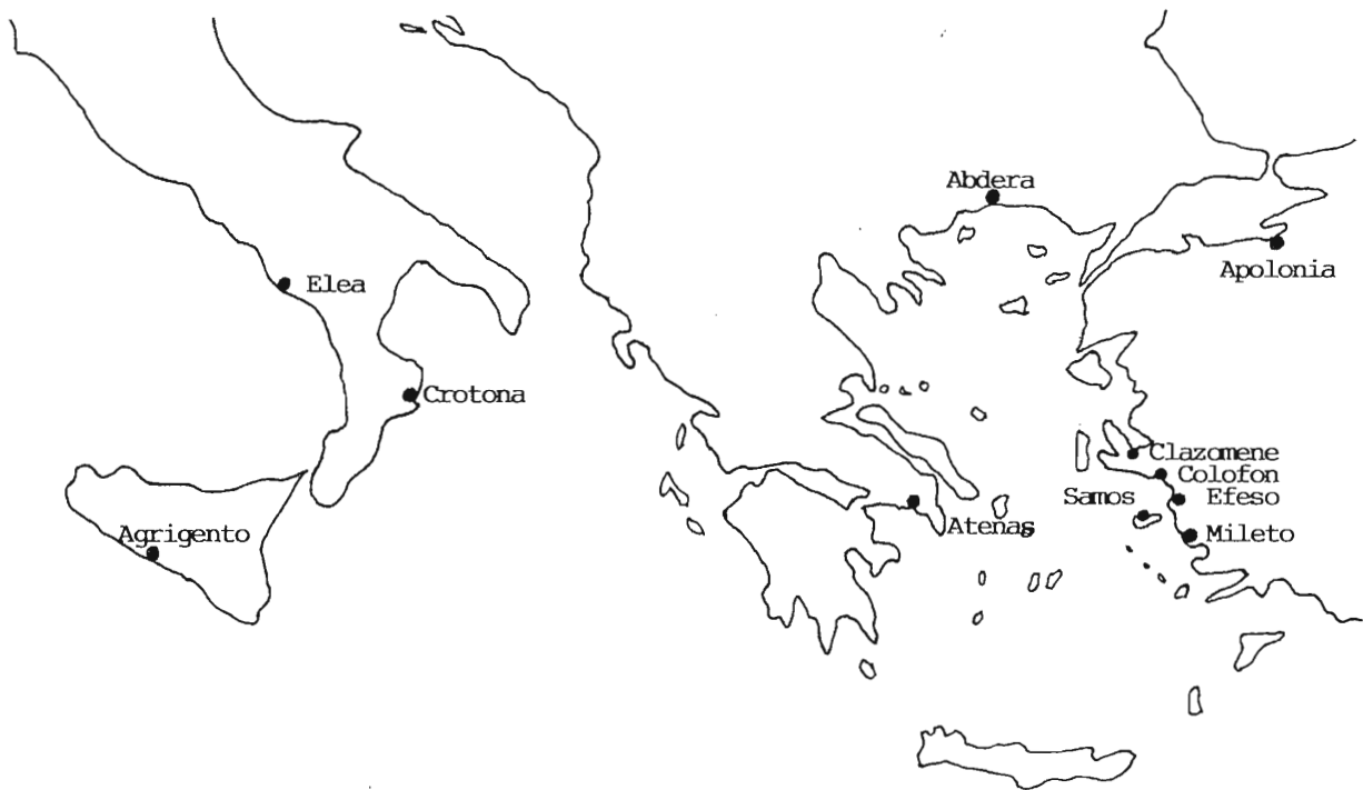
Fig. 7: Antiguo mapa de Grecia con las ciudades que aparecen en el artículo.