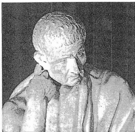
Fig. 1: Aristóteles (384-322 a. de C.) según una versión romana; Palazzo Spada, Roma. En este trabajo aparecen varias citas suyas.

VI a. de C. en Mileto, colonia griega situada en las costas mediterráneas de la península de Anatolia. En realidad, esta fecha ya fue propuesta por Aristóteles y no se ha encontrado ninguna razón para modificarla. No pretendemos decir que en Mileto naciera el pensamiento racional de modo instantáneo y brusco (nada nace de la nada), sino más bien que se produjo un punto de inflexión fundamental en el modo de buscar respuestas a los interrogantes que la Naturaleza plantea.