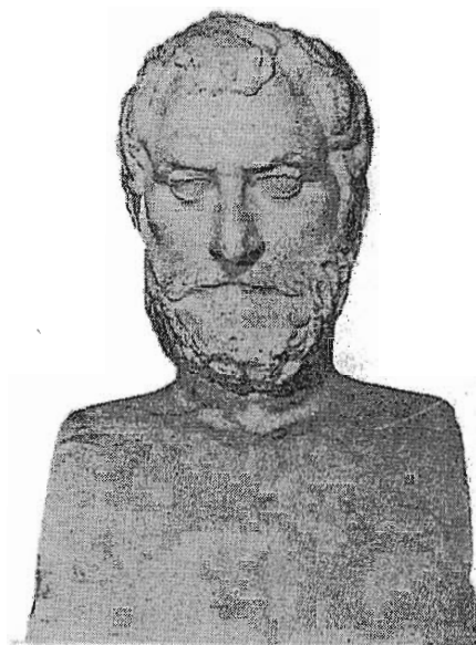
Fig. 2.- Tales de Mileto -en la imagen, busto helenístico conservado en el Museo Vaticano- es considerado como el primer hombre que intentó explicar la Naturaleza recurriendo sólo a la razón.

Los truenos y relámpagos son explicados a partir del viento de la siguiente manera: "Cuando el viento es circundado por una nube densa, cae forzado por la pequeñez de sus partículas y por su liviandad; el estallido produce entonces el ruido, y su disposición en relación con la negrura de la nube el resplandor" 5 ; el rayo, finalmente, es "el curso del viento más ardiente y más denso." 6