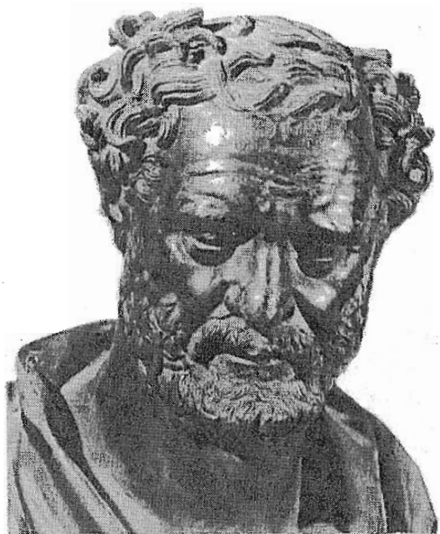
Fig. 8.- Demócrito de Abdera: busto en bronce conservado en el Museo Nacional de Nápoles. Elaboró un calendario meteorológico para realizar predicciones del tiempo.

nos autores sitúan su nacimiento en Elea o en Abdera), en torno al 500 a. de C. En Abdera fundó su escuela y escribió sus dos obras: "Sobre la Mente" y la "Gran ordenación del mundo". Demócrito, por su parte, nació en Abdera alrededor del 475 a. de C. y, según los doxógrafos, vivió al menos 90 años. Debió de ser uno de los autores más prolíficos de la antigüedad, pues se le han asignado 52 escritos, aunque algunos de ellos muy breves, que abarcan prácticamente todos los temas. Uno de estos libros tenía, para nosotros, el significativo nombre de "Cuestiones atmosféricas". Nos han llegado de él una cantidad bastante apreciable de fragmentos, pero las tres cuartas partes se refieren exclusivamente a cuestiones morales. La idea básica del atomismo es que la realidad está constituida por un número infinito de partículas (átomos) de magnitud mínima (no pueden ser percibidos por los sentidos), inalterables y sin diversidad cualitativa (se distinguen sólo por su figura, orden y posición). La interacción de estos átomos en el vacío da lugar a la formación de los compuestos sensibles, y es el resultado de la "necesidad", entendida como una ley universal que todo lo gobierna. Sobre sus opiniones meteorológicas conservamos muy poco de Leucipo y bastante más de Demócrito, de quien nos ha llegado un calendario meteorológico que tenía carácter