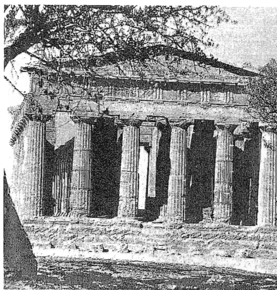
Fig. 5.- Templo de la Concordia, de Agrigento: construido en tiempos de Empédocles (siglo V a. de C.), constituye uno de los más altos ejemplos de arquitectura dórica. La ciudad de Agrigento fue definida por Píndaro como "la más bella entre las que habitan los mortales" .

Al igual que Jenófanes, nos dice que el viento y la lluvia provienen del mar: "Desde el mar trae Iris viento o enorme lluvia" 24 , pero no conservamos ninguna explicación más aclaratoria.