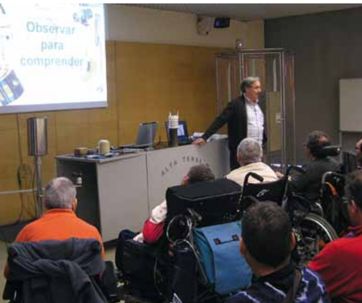
Explicación del funcionamiento de instrumentos meteorológicos en una de las sesiones realizadas en el taller "Observar para comprender".