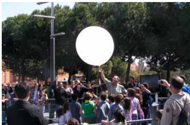
Un corro de niños sueltan el globo sonda de helio durante el lanzamiento de uno de los sondeos meteorológicos

ganizadas por la AME y la Fundación la Caixa para conmemorar el Día Meteorológico Mundial 2012.