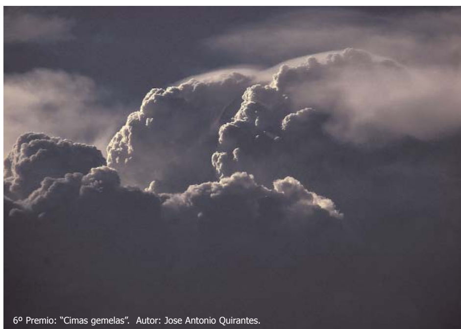
6º Premio: "Cimas gemelas". Autor: Jose Antonio Quirantes.