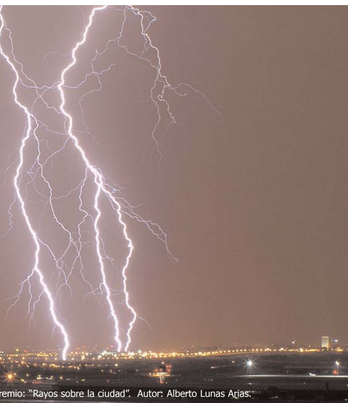
1er Premio: "Rayos sobre la ciudad". Autor: Alberto Lunas Arjas.