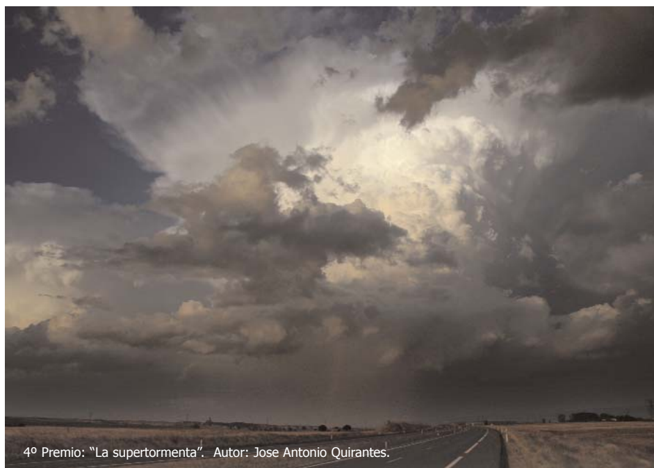
4 o Premio: "La supertormenta". Autor: Jose Antonio Quirantes.

U NA vez más, el boletín de la AME acoge las mejores instantáneas de los apasionados por la fotografía meteorológica, a través del celebrado con motivo del V Encuentro Nacional de Aficionados a la Meteorología, que fue organizado por la recientemente creada Asociación de Aficionados a la Meteorología. Con una gran participación, se desarrolló en Sevilla los días 30 y 31 de Octubre. El concurso presentaba dos temáticas: tormentas y fotografías de paisajes. Las fotos ganadoras no dejan lugar a dudas de que las tormentas son los fenómenos que provocan mayor atracción entre los aficionados. Las fotografías ganadoras fueron: "Convección masiva" (1 er premio), "La supertormenta" (4 o premio) y "Primer rayo de sol del día" (5 o premio). Estas tres fotografías fueron las más votadas entre las seis más votadas y también a los organizadores del encuentro y del concurso por el excelente resultado y por la calidad de las fotografías.