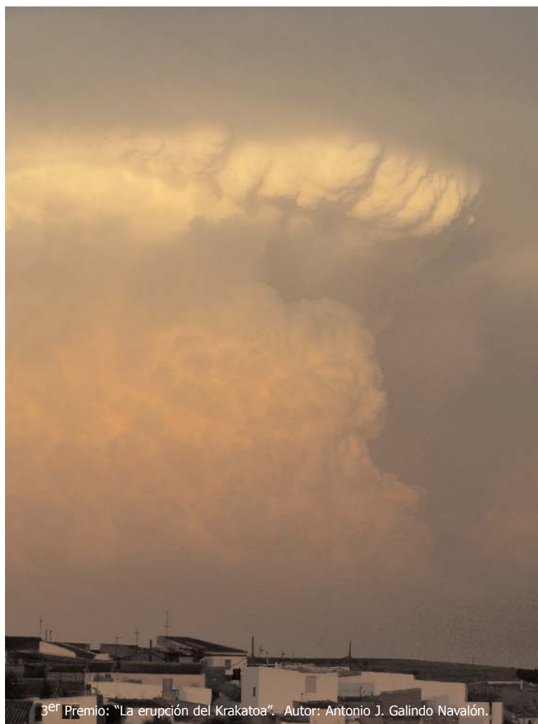
3er Premio: "La erupción del Krakatoa".