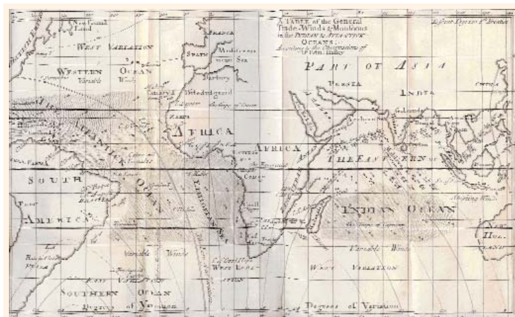
Figura 1. Mapa de vientos de Barlow (1715) según las observaciones de Halley.

Del mismo principio se sigue que este viento del este ha de soplar, al norte del ecuador, del noreste, y en latitudes australes, del sureste; pues cerca de la línea, el aire está mucho más enrarecido que a una mayor distancia de ella, y el sol, que se encuentra dos veces al año en el cenit, en ningún momento se aleja más de 23.5 grados de latitud, donde el calor, siendo proporcional al seno del ángulo de incidencia, no difiere mucho del del rayo perpendicular; mientras que bajo los trópicos, aunque el sol se mantenga largamente aplomado, puede estar alejado de 47 grados, de donde resulta una especie de invierno, durante el cual el aire se enfría hasta tal punto que el calor estival no lo puede calentar en un mismo grado como ocurre con el aire bajo el ecuador. Por lo tanto, el aire al norte y al sur, más denso que en el centro, ha de tender de ambos lados hacia el ecuador: este movimiento del viento, combinado con el anterior, del este, dilucida todos los fenómenos de los vientos alisios, que indudablemente soplarían durante todo el año, si toda la superficie del globo constara de mar, como sabemos que lo hacen en los océanos Atlántico y Etiópico.»