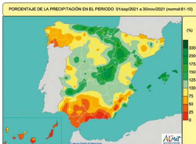
Figura 2. Porcentaje de la precipitación acumulada desde el 01/09/2021 al 30/11/2021 respecto al periodo 1981-2010.

En cuanto al carácter de la precipitación; septiembre fue en general muy húmedo aunque hubo algunas regiones de carácter seco como Canarias, las provincias de Granada, Almería, Alicante y la costa de Barcelona, fue normal en Galicia, Huesca y Lleida. Octubre fue en general seco, muy seco o normal, salvo en zonas de Extremadura, Madrid y la Castilla la Mancha donde fue húmedo y localmente muy húmedo. Noviembre fue en general seco, extremadamente seco en Extremadura, parte de Galicia, León, oeste y sureste de Andalucía, así como la mayor parte de Canarias; por el contrario fue extremadamente húmedo en la cornisa cantábrica, sistema Ibérico norte, Tortosa-Beceite, Baleares y puntos concretos dispersos del litoral mediterráneo del Levante.