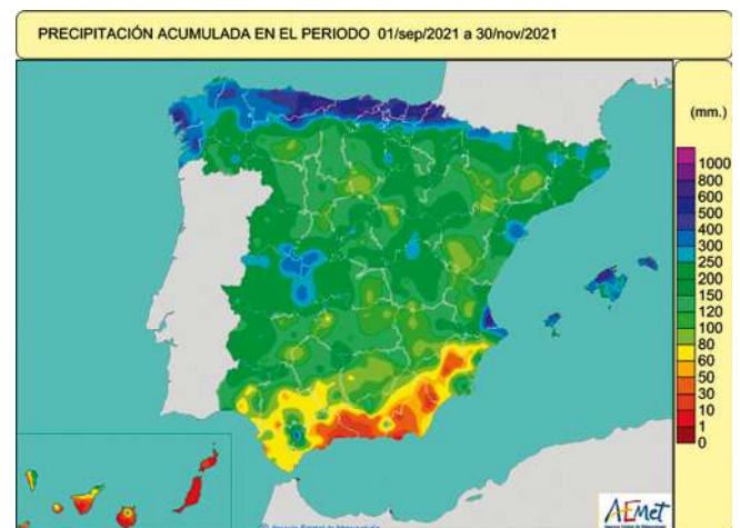
Figura 1. Precipitación acumulada en el periodo del 01/09/2021 al 30/11/2021

inferiores a las normales (por debajo del 25 %) en algunas comarcas de Murcia, Almería, Granada, Málaga y Canarias; por el contrario las anomalías de precipitación fueron claramente positivas en el Cantábrico, el sistema Ibérico norte, La Mancha, el sur de Extremadura y en Baleares (figura 2).