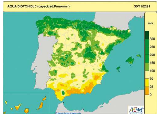
Figura 6. Agua disponible para las plantas, o reserva de humedad edáfica en mm, considerando la capacidad de retención máxima del lugar, el día 30 de noviembre de 2021.

A primeros de octubre comenzó la montanera con buen estado de pasto y bellota “migualeña”, la primera quincena del mes fue calurosa y seca y a mediados en muchos lugares los suelos y pastos estaban relativamente secos, la tierra sin tempero adecuado para las siembras de avena y centeno, pero durante la tercera decena del mes llegaron las lluvias generalizadas y las primeras heladas en los pagos favorables, mejorando “la otoñada” ( el pasto de “yerbios” y la sazón de la tierra ). A finales de la primera decena