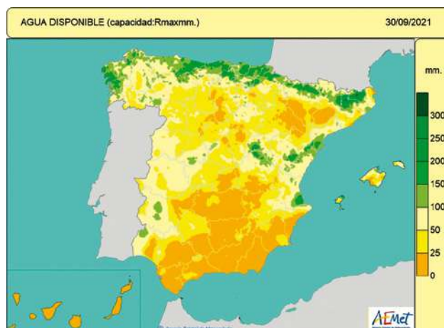
Figura 4. Agua disponible para las plantas, o reserva de humedad edáfica en mm, considerando la capacidad de retención máxima del lugar, el día 30 de septiembre de 2021.

Respecto a la humedad edáfica, al finalizar septiembre los suelos estaban secos o poco húmedos en la mayor parte del territorio peninsular e insular, salvo zonas costeras y algunas montañosas de Galicia y la cornisa Cantábrica; zonas del Prepirineo y Pirineo, Tortosa-Beceite-Baix Ebre, La Marina alicantina y montañas del sistema Ibérico sur (figura 4). A finales de octubre seguían estando los suelos muy poco húmedos en el sureste peninsular, la meseta Central y el valle del Ebro, pero ya no en Galicia,