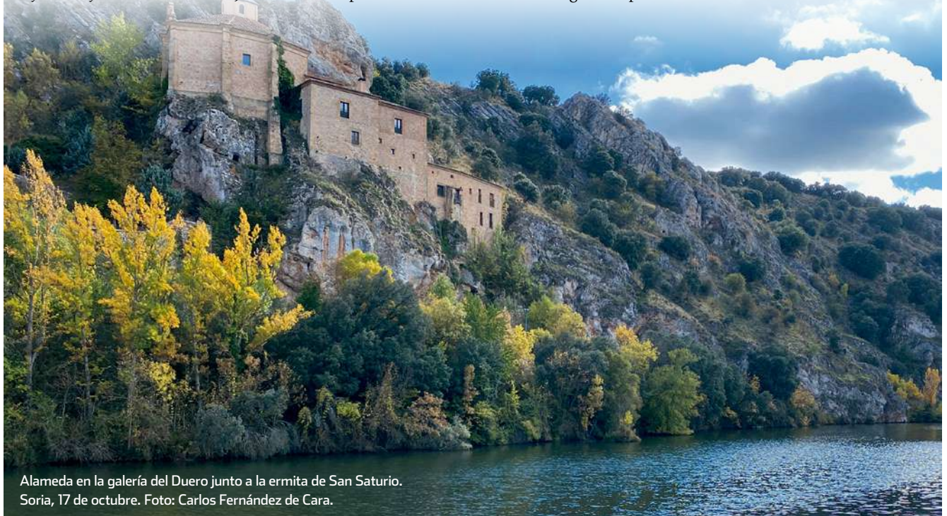
Alameda en la galería del Duero junto a la ermita de San Saturio. Soria, 17 de octubre.

A primeros de octubre había algo de humedad en la capa superficial de los suelos de las sierras y somontanos lo que permitió la aparición de varias especies de setas. No obstante, los suelos en general no estaban empapados y en muchos arroyos aún no corría agua. En piedemontes del norte del sistema Central la