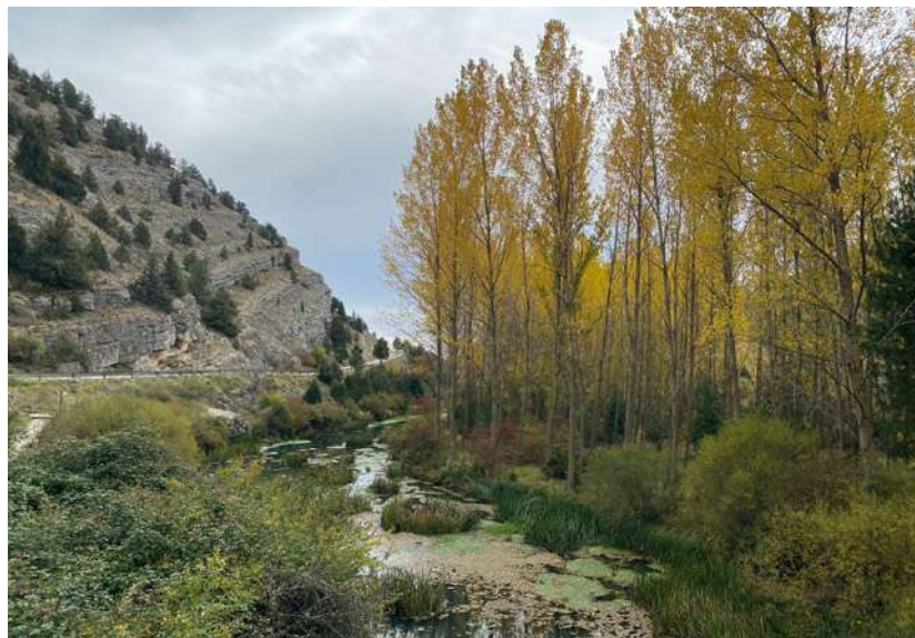
Plantación de chopos en la entrada del Cañón del Río Lobos (Ucero, Soria, 16 de octubre).

ble, ciruelo, manzano, chopo, cerezo, peral, endrino). Noviembre fue muy frío y extremadamente húmedo (con lluvias persistentes sobre todo entre los días 21 al 29). Muchos caducifolios mantuvieron las hojas con total cambio de color hasta el comienzo de la tercera decena cuando se generalizó la caída de las mismas. A primeros de diciembre el tiempo invernal con heladas dejó los árboles totalmente sin hojas.