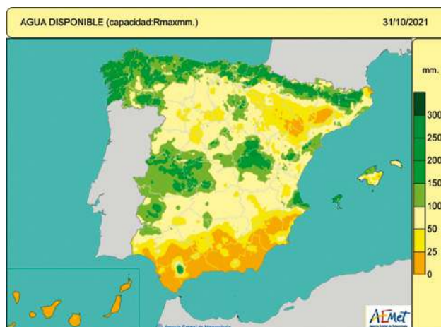
Figura 5. Agua disponible para las plantas, o reserva de humedad edáfica en mm, considerando la capacidad de retención máxima del lugar, el día 31 de octubre de 2021.

los entornos de las montañas de los sistemas Ibérico y Central, Extremadura y oeste de Toledo y las islas Pitiusas (figura 5). A finales del mes de noviembre los suelos aún estaban secos o muy poco húmedos en muchas comarcas del sur y sureste peninsulares, además de en Canarias. No obstante en la mitad norte durante noviembre se favoreció la humedad edáfica y caudal de pequeños arroyos, en topografías favorables, debido a la alternancia de pequeñas nevadas en las cumbres y su deshielo, y al rocío y nieblas matutinas (figura 6).