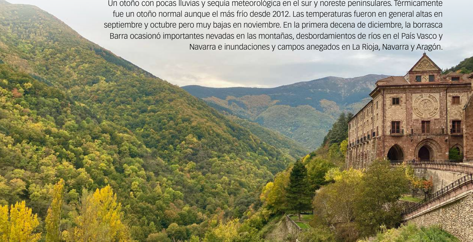
Bosque mixto de hayedo con pino silvestre en Valvanera (La Rioja, 16 de octubre).

Un otoño con pocas lluvias y sequía meteorológica en el sur y noreste peninsulares. Térmicamente fue un otoño normal aunque el más frío desde 2012. Las temperaturas fueron en general altas en septiembre y octubre pero muy bajas en noviembre. En la primera decena de diciembre, la borrasca Barra ocasionó importantes nevadas en las montañas, desbordamientos de ríos en el País Vasco y Navarra e inundaciones y campos anegados en La Rioja, Navarra y Aragón.