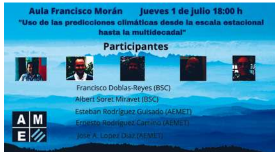
Imágenes publicadas en redes sociales para anunciar las distintas charlas del Aula Morán