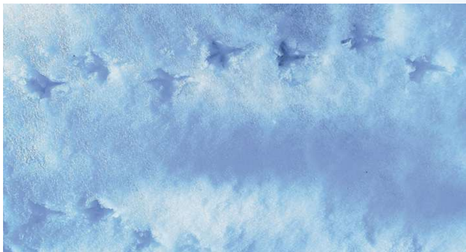
Figura 4. Huellas sobre la nieve. Los pequeños pájaros que buscan su alimento en el suelo son incapaces de acceder a él cuando la nieve acumulada supera un determinado espesor por lo que se ven obligados a desplazarse a otros territorios.

este modo, las especies de aves con gran capacidad de vuelo como la avefría europea ( Vanellus vanellus ), la abubilla común ( Upupa epops ) y la alondra común ( Alauda arvensis ), dejaron de observarse el día siguiente de la nevada. En el caso de las alondras, no volvieron a verse las primeras bandadas hasta el 22 de enero, un día después de desaparecer la nieve del suelo, mientras que las avefrías y abubillas lo hicieron mucho más tarde, ya entrado el mes de febrero.