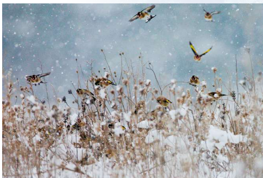
Figura 5. Bandada de jilgueros europeos ( Carduelis carduelis ) buscando alimento sobre plantas que todavía están al descubierto de la nieve. Fotografía: Carlos Cano-Barbacil.