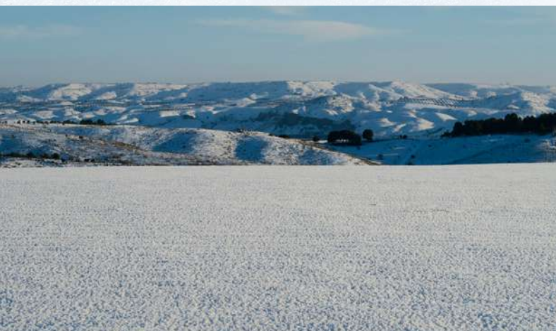
Figura 3. Campos de cultivo en secano y manchas de pinar cubiertos por la nieve en Colmenar de Oreja (Madrid).

Para superar estas condiciones tan desfavorables, la estrategia utilizada por algunas aves fue la emigración forzada en busca de lugares libres de nieve, lo que se denomina fuga de tempero (Cano 1992; Cano-Barbacil y Cano 2017). De