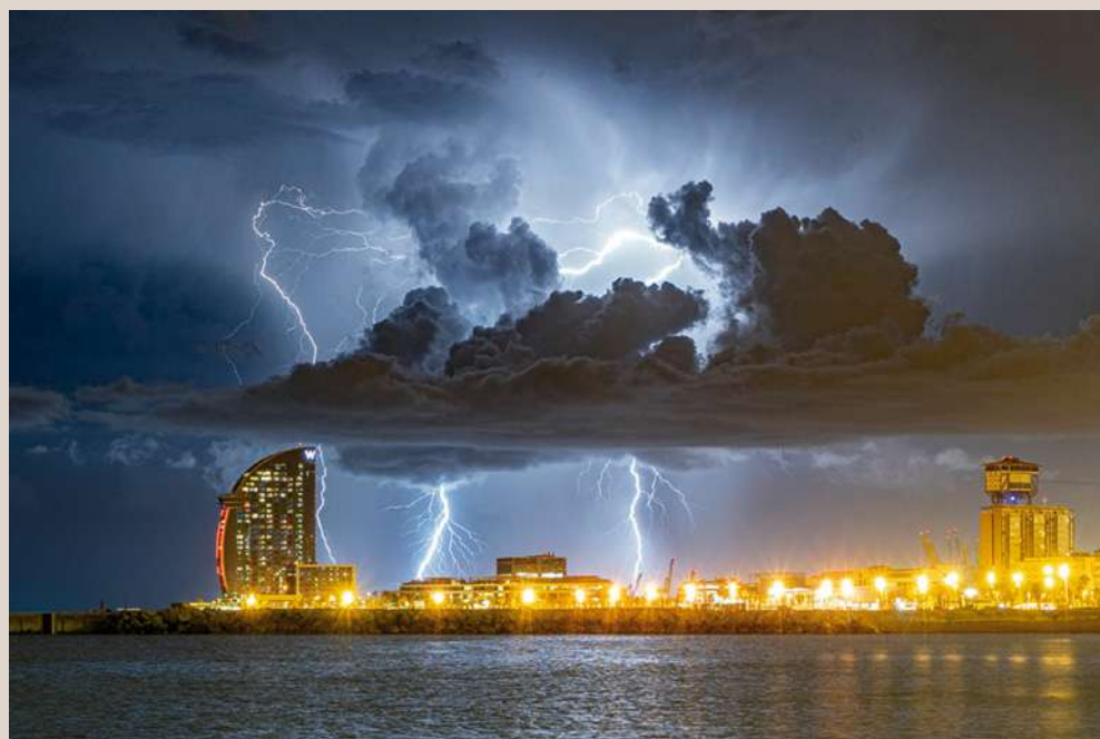
"Hotel de luz", de Enric Navarrete Bachs. Segundo puesto del Concurso Foto-otoño'2020

Se da además la circunstancia de que las dos primeras fotografías clasificadas del concurso corresponden a una mis-