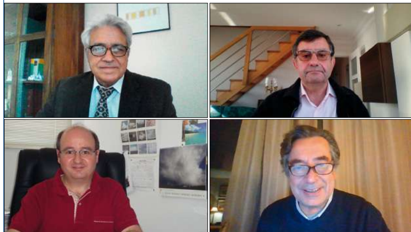
Figura 4. Algunos de los participantes en la junta virtual del 4 de noviembre de 2020

Por lo que respecta a la procedencia geográfica, tal como vemos en la figura 2 y 3, tenemos lectores en 63 países con 66 idiomas diferentes. El pasado trimestre destacaron: España (41.89 %), México (23.37 %), Estados Unidos (5.28 %), Perú (4.88 %), Argentina (4.82 %), Ecuador (3.64 %), Colombia