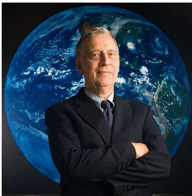
Ralph J. Cicerone.

siempre con la atención puesta en aquellos procesos realmente importantes para los problemas de ámbito global.