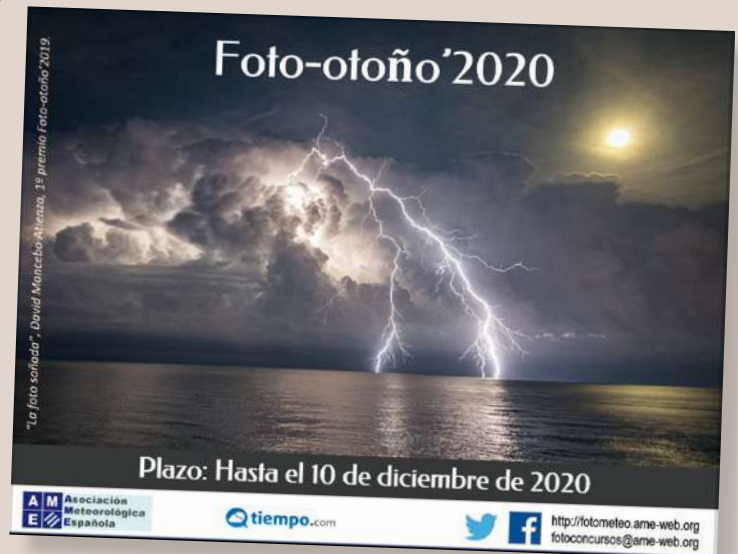
Cartel del próximo concurso: Foto-otoño'2020