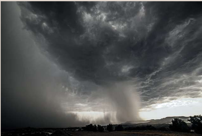
"Cortina de granizo", de Carme Molist Vidal. Segundo puesto del Concurso Fotoverano'2020

Destaca, tal como es habitual en los concursos de verano, que la temática dominante entre las fotos presentadas fueron las tormentas y, dentro de éstas, los rayos. Así entre las trece primeras fotografías clasificadas, doce son de tormentas, y nueve de ellas de descargas eléctricas. Una de ellas fue la fotografía ganadora, "Anvil Crawler sobre Madrid", que sumó 267 puntos del jurado, y que muestra una imponente descarga sobre el horizonte urbano nocturno de la capital de España. Su autor es Alberto Lunas y la podemos disfrutar en las