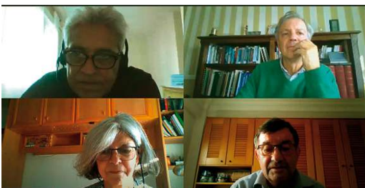
Figura 3. Algunos de los participantes en la junta virtual del 7 de octubre de 2020

Debido al período estival sólo se ha mantenido una reunión por videoconferencia el pasado día 7 de octubre. De los temas tratados en esa reunión así como de otros despachados a lo largo del verano por los miembros de la Junta informamos en otros apartados.