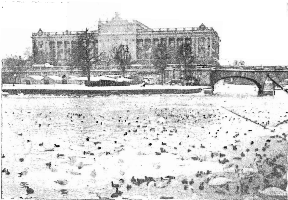
Palacio del Parlamento. En primer plano se observa una amplia variedad de cisnes, patos y gaviotas sobre el fondo nevado.

El viajero que llega a Estocolmo lo primero que advierte sea, quizá, que Suecia no es un país turístico, hecho que se refleja en las características de los hoteles: precios bastante altos y pocas comodidades. El contraste para