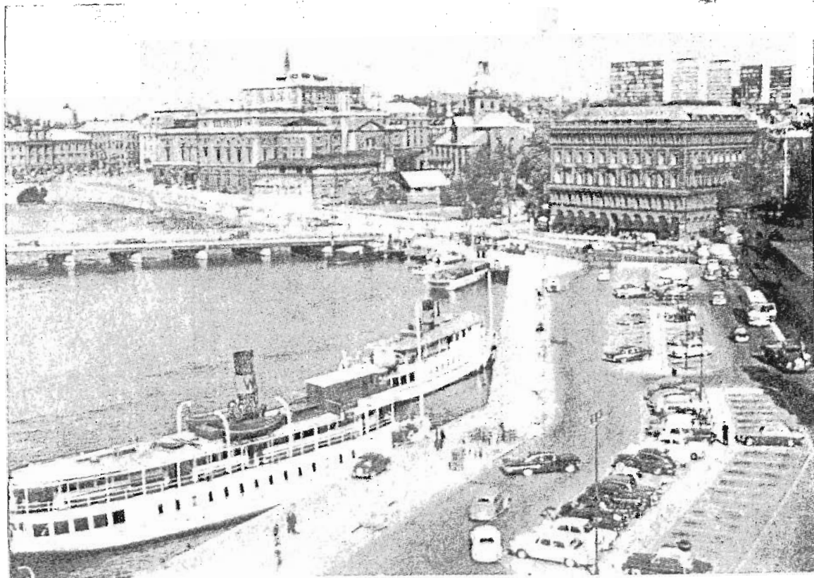
Vista de la plaza de Carlos XII y del Palacio de la Opera.

los españoles es mayor, pues nuestros hoteles son, en general, modernos y relativamente baratos.