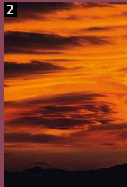
Foto 2- “Cada sol tiene su ocaso”. Montserrat 30 de marzo 2015

De fondo podría sonar “Gitana hechicera”, de Peret. Ella tiene poder, ella tiene poder, Barcelona es poderosa, Barcelona tiene poder.... Pero esta enorme ciudad, llena de actividad y de bullicio, acaba de someterse al poder de una pequeña tormenta de invierno que ha cubierto sus calles de granizo.