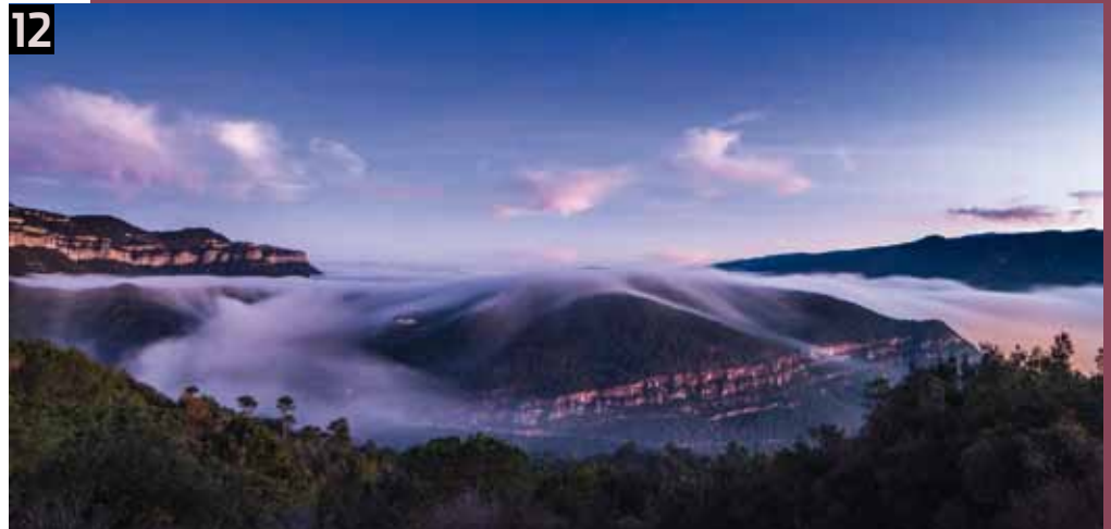
Foto 12- "Niebla". L'Ametlla del Vallès 11 de diciembre 2015. "Nadie se queja de la niebla. Ahora ya sé por qué: aunque resulte molesta, permite hundirse en ella y sentirse seguro"( Ken Kesey). La estabilidad atmosférica y las anormalmente altas temperaturas de este diciembre favorecen la lectura.