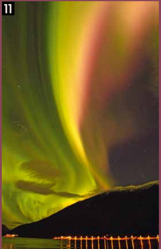
Foto 11- "Auroras... o como enmudecer". Kvaløya (Noruega) 11 de noviembre 2015. Has visto miles de fotografías de las luces del norte... pero cuando a las cuatro de la tarde (noche cerrada) el cielo se tiñe de color verde -casi fosforito-, amarillo -canario- y rosa -fucsia-... no encuentras las palabras, disfrutas.