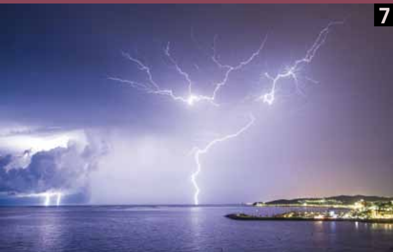
Foto 7- "No hay dos iguales". Sitges 26 de septiembre 2015 En septiembre hubo varios episodios tormentosos. A menudo las personas olvidamos lo que decimos, lo que hacemos... pero es muy difícil olvidar los efectos que la adrenalina provoca en una noche de tormenta como esta.