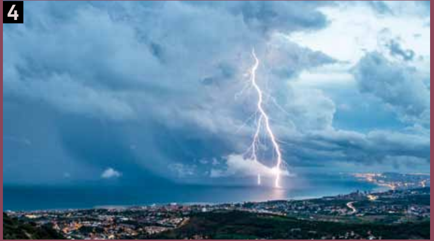
Foto 4- "No vamos a esperar que pase la tormenta". Barcelona 14 de agosto 2015 Después del calor sofocante y de la monotonía anticiclónica del mes de julio, agosto empezó con varias tardes de tormentas veraniegas. La del día 14 nos hizo levantar de la tumbona y correr hacia la costa. Allí nos encontramos con una violenta tormenta: se desplazaba lenta pero acompañada de intensa lluvia, niebla, viento, fresquito y... muchos rayos!.