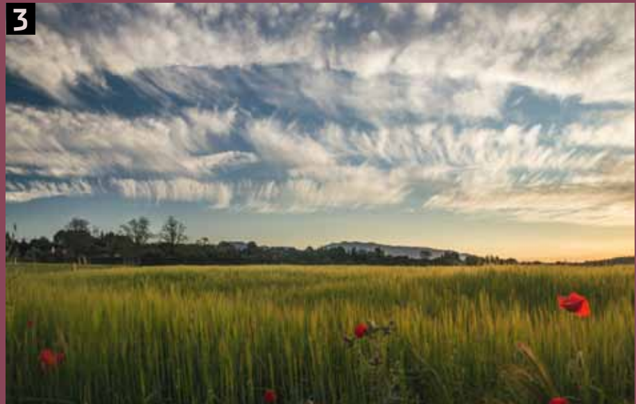
Foto 3- "Pintando el cielo". Les Franqueses del Vallès, 23 de abril 2015.