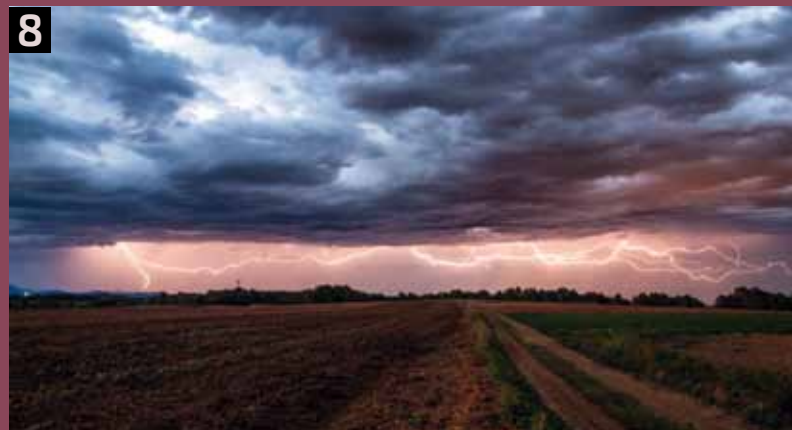
Foto 8- "Si Tesla viera esto". Campllong (La Selva - Girona), 06 de octubre 2015 Se calcula que cada rayo descarga entre 1.000 y 10.000 millones de julios de energía, con una corriente de hasta 200.000 amperios y 100 millones de voltios. Esa noche íbamos sobrados de energía.