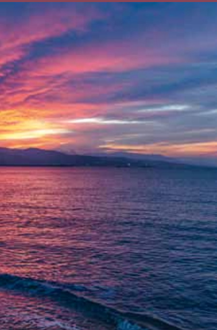
Foto 3- "Al Alba": Málaga. 7-9-2014 En esos momentos los colores del cobre y el oro viejo, se hacen dueños del cielo y el mar eclipsando las luces y formas de la ciudad.